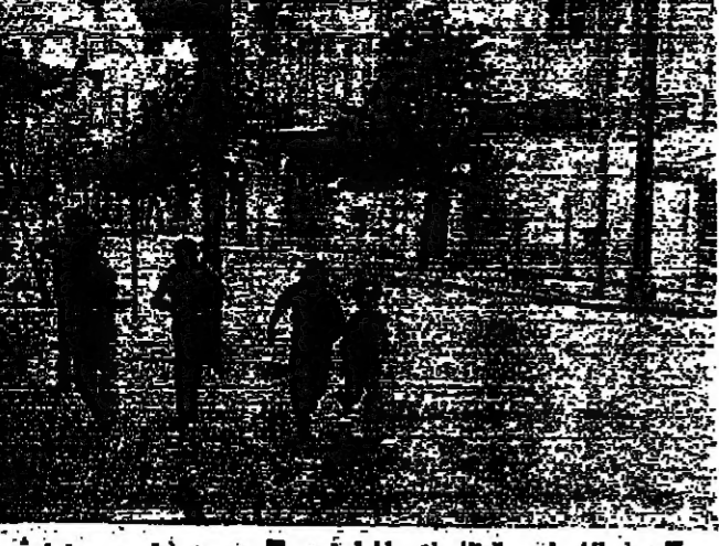
في الشوارع بانتظار فتح المدارس

كان من المقرر ان يفتح المعلمون بالمدراس الرسمية في بيروت امس التشرين بناء لخدمة من مدير عام وزارة التربية الدكتور جمال بصلي ، الا ان ذلك لم يحصل . وقال الدكتور بصلي ان تسردى الاضواء الثانية حال دون وصول المعلمين الى المدارس ، وبالتالي عدم استئناف العمل في هذه المدارس . هذا ولا تزال معظم مدارس بيروت الرسمية مغلقة لاشراك المعلمين التسوية التي تولى الترسيع فيها باعتبار قيام وزارة التربية بهذه الهمة . رابطة شهاب بيروت ● وانصابت رابطة شباب وشهوات